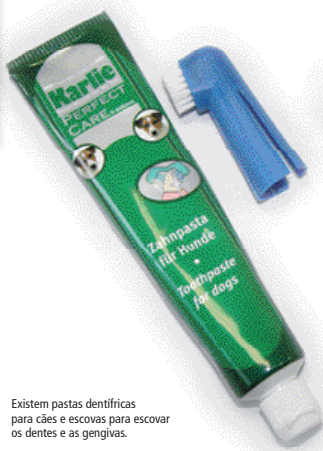
Existem pastas dentífricas para cães e escovas para escovar os dentes e as gengivas.